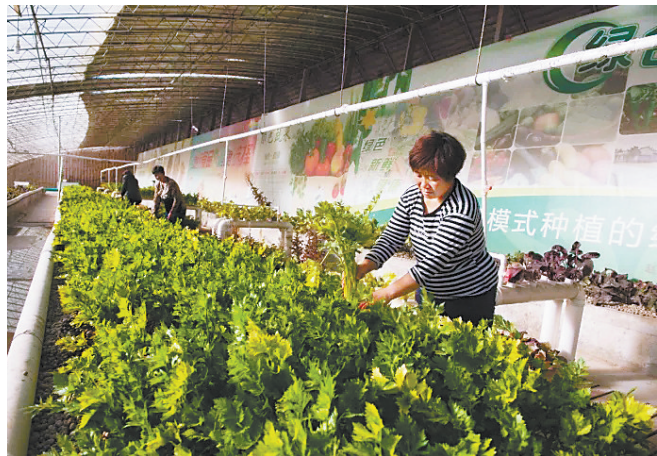
赵县无公害蔬菜生产基地。

目前,赵县蔬菜播种面积共14.5万亩,其中11万亩蔬菜实现绿色无公害认证,总产约87万吨。近年来,该县全面推广无公害蔬菜机械化生产关键技术,提升标准化蔬菜生产水平,共建立15个无公害蔬