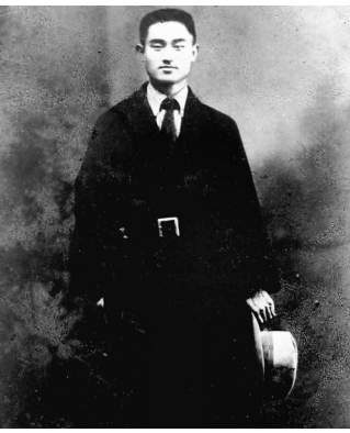
汪寿华(资料照片)。