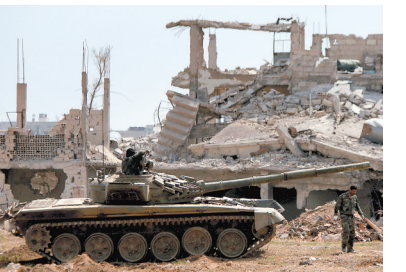
4月29日,在叙利亚首都大马士革南部地区,叙政府军打击伊斯兰国的军事行动仍在持续推进。

声明指出,俄土伊三方决心抵制某些势力破坏叙主权和领土完整的图谋,继续合作打击伊斯兰国、征服阵线和其他恐怖极端组织,要求叙国内各武装派别立刻与恐怖极端组织划清界限。此外,三国外长要求禁止化学武器使用,依据相关公约和事实,对叙境内使用化武的消息进行及时专业的调查。