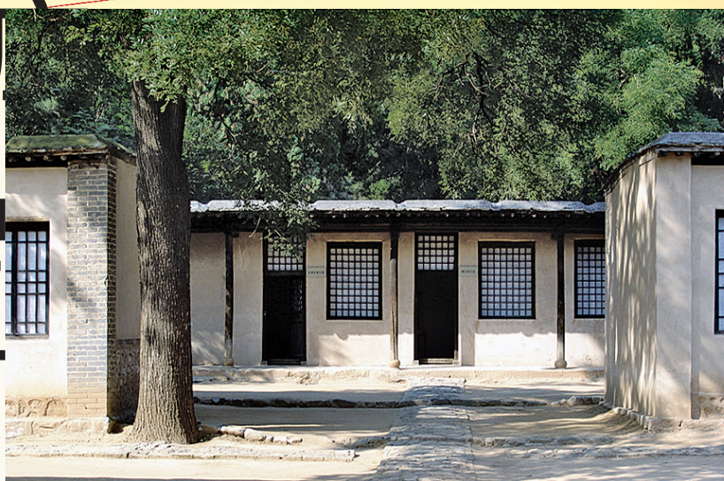
毛泽东在城南庄居住的旧址。