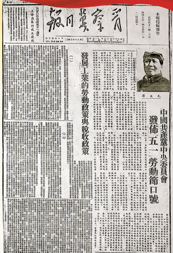
1948年5月1日,《晋察冀日报》头版头条刊登五一口号。

冉世民表示,实践证明,在五一口号下催生出来的我国新型政党制度具有鲜明中国特色、中国气派、中国智慧,是对人类政治文明的重大贡献。进入新时代,我们要继续毫不动摇坚持中国共产党领导,坚决维护习近平总书记核心地位,坚决维护党中央权威和集中统一领导,不断巩固共同思想政治基础,努力把多党合作事业推向更高层次,团结一切可以团结的力量,共同为实现中华民族伟大复兴中国梦而努力奋斗,这也是我们对五一口号精神最好的继承和弘扬。