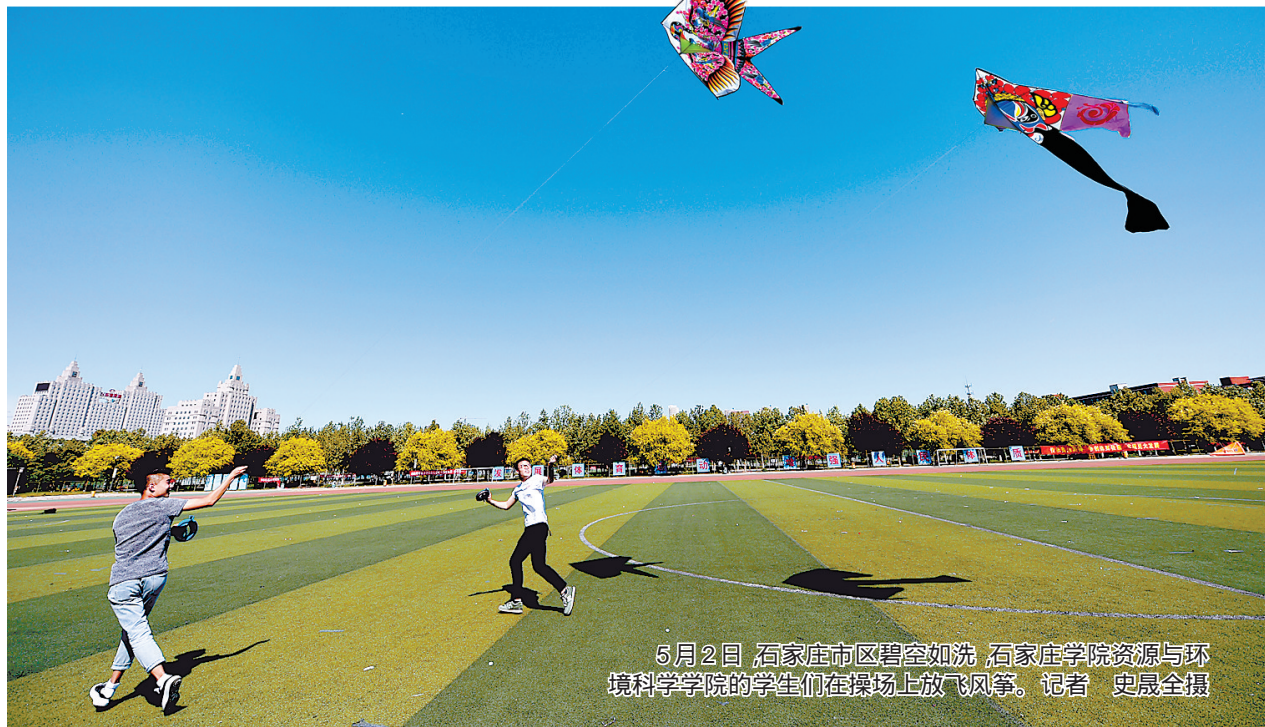
5月2日,石家庄市碧空如洗,石家庄学院资源与环境科学学院的学生们在操场上放飞风筝。

本报讯(记者段丽茜、王峻峰)从石家庄市大气和水污染防治指挥部办公室获悉,2017年10月1日至今年3月31日,石家庄市优良天数为76天,同比增加29天。据统计,2017年10月1日至2017年12月31日,该市空气质量综合指数和PM2.5平均浓度同比下降48%和54.8%,在京津冀大气污染传输通道2+26城市中降幅排名第二。2017年,该市出台了一岗双责、党政同责等规章制度,制定了限制发展和禁止发展产业目录等专项规划,印发1+19专项行动方案,并开展了秋冬季大气污染综合治理强化攻坚。监测显示,今年以来,石家庄市空气质量持续改善。截至5月2日,该市PM2.5平均浓度为96微克/立方米,同比下降20.7%。