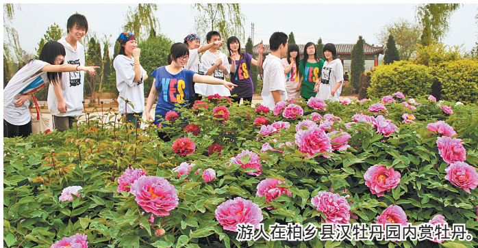
游人在柏乡县汉牡丹园内赏牡丹。