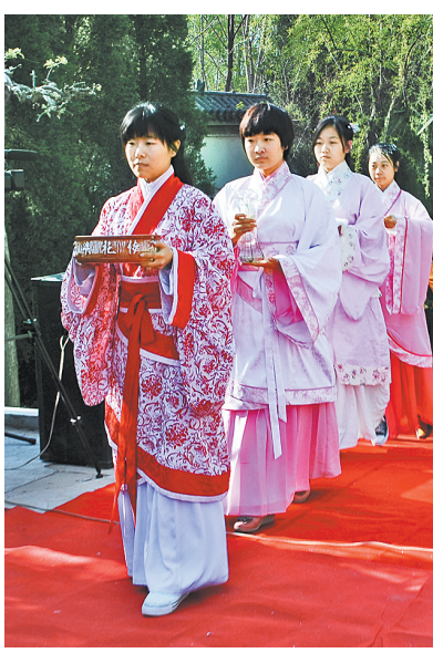
中国汉牡丹文化节上的传统文化活动。