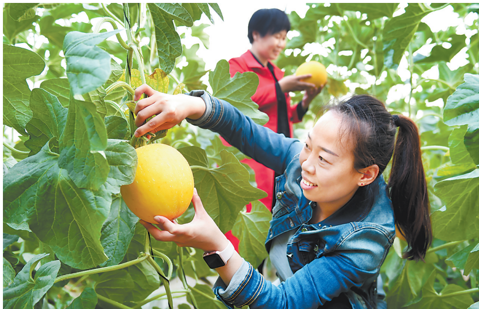
近日,在临城县黑城乡胶泥沟村生态采摘园,游客在甜瓜大棚内采摘。近年来,该县依托当地优势农产品,因地制宜推进休闲农业和乡村旅游发展,建设30多个生态农旅观光项目,打造了一批环境优美、宜居宜游的特色乡村,吸引了众多游客。

据悉,评选活动分为选拔、复评、终评三个阶段。网友可在河北新闻网专题页面及河北新闻网官方微信公众号、《藏书报》微信公众号进行投票。8月底,将在石家庄以现场录播形式进行决赛。