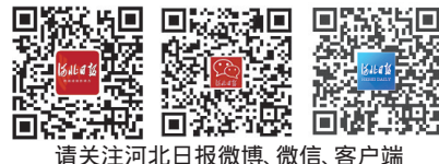
请关注河北日报微博、微信、客户端