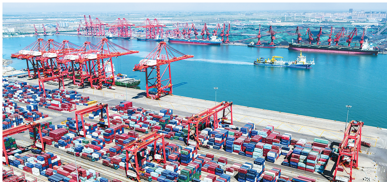
近日,唐山港京唐港区国际集装箱码头一片繁忙。近年来,该港区抢抓一带一路建设机遇,加快发展集装箱运输,形成了以直达东南沿海主要港口为基础,以直达日韩、联通世界为拓展的集装箱海上网络。

本次活动以奋斗新时代,践行新思想,实现新作为为主题,通过大型讲述、网络征文、奋斗者分享日、公益体验、大型主题晚会等一系列形式,把石家庄市优秀奋斗者的奋斗故事、心路历程和时代感呈现给社会大众,唱响时代主旋律,传递社会正能量,为建设现代省会、经济强市凝聚强大的精神力量。