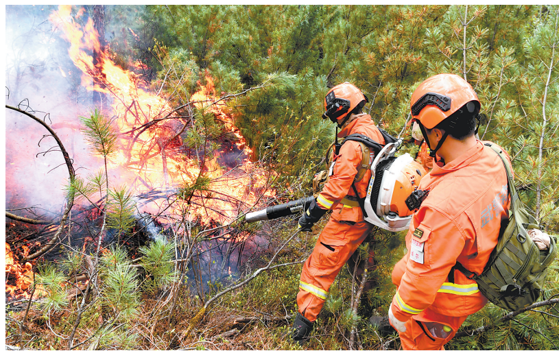
6月4日，武警森林部队官兵在汗马国家级自然保护区进行扑火。

记者从黑龙江大兴安岭呼中森林防火前线指挥部了解到，截至6月4日15时，发生于内蒙古大兴安岭汗马国家级自然保护区的过境林火火线已达约10公里，火场纵深2.87公里，火势尚未得到有效控制。黑龙江省已调动武警森林部队、专业扑火队等3600余人，调集推土机、钩机、装载机等大型机械装备参与扑救。