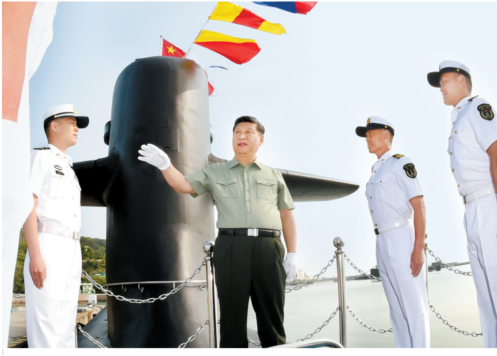
6月11日下午,中共中央总书记、国家主席、中央军委主席习近平视察北部战区海军。这是习近平来到某潜艇部队,登上潜艇,同艇员亲切交谈。新华社发

新华社济南6月15日电(记者李宣良、吴登峰)中共中央总书记、国家主席、中央军委主席习近平11日下午视察北部战区海军,强调要坚决贯彻新时代党的强军思想,坚持政治建军、改革强军、科技兴军、依法治军,贯彻转型建设要求,锻造海上精兵劲旅,坚决完成党和人民赋予的各项任务。 夏日的青岛,红瓦绿树,碧海清风。15时30分许,习近平来到某潜艇部队,首先听取了部队建设有关情况介绍。军港码头上,前不久参加过南海海域海上阅兵的某新型潜艇伏波静卧,满旗高悬,艇员们在艇面上分区列队,精神抖擞迎接习近平到来。习近平登上潜艇,走到艇员们中间。习近平一直牵挂着常年奋斗在深海洋的潜艇兵们,他关切询问官兵的工作生活情况。了解到官兵们爱岗敬业、战