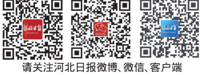
请关注河北日报微博、微信、客户端