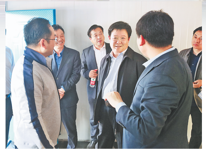
县政府主要领导带领有关部门多次深入浩博希望城调研。