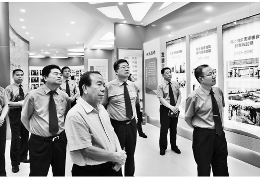
邢台市人民检察院领导班子到柏乡粮库进行参观学习 现场感悟 柏粮精神。

邢台市人民检察院：网上检察室新平台是由侦查监督网上检察室、审判监督网上检察室和执行监督网上检察室三部分组成。侦查监督网上检察室通过运用大数据技术，分析公安机关公开的行政处罚决定等数据，对其行政执法活动中存在的该立案不立案和程序违法等行为进行智能化监督。审判监督网上检察室通过运用大数据技术，分析审判机关公开或直接提供的案件数据，实现对审判组织、简易程序、立案期限执行完毕、终结执行等环节的智能化监督。执行监督网上检察室通过运用大数据技术，分析司法机关移交或提供的案件数据，实现减刑、财产执行等智能化监督。三个网上检察室相互协作，形成一个涵盖检察机关全部监督业务的有机体系，不仅提高了监督的覆盖面、精细度、智能化，而且还提升了监督效率，节约了大量人力、物力，更好地维护了检察职能。