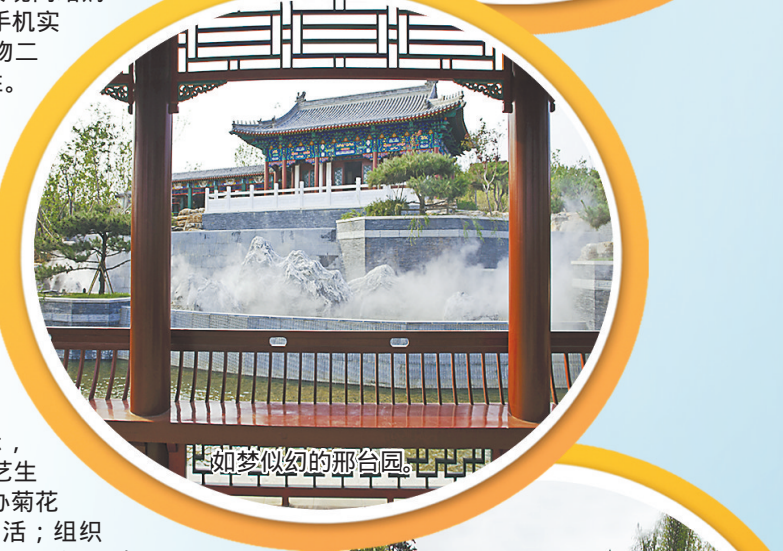
如梦似幻的邢台园。

百姓园博,普惠共享。会期参与性共享,园区特色植物及绿色馆阳台花园、园艺生活的展示,使老百姓获取更多的园艺生活知识;会展期间组织举办菊花等花卉展览,丰富百姓生活;组织国内外插花大师现场表演,现场互动,激发百姓参与热情;会后持续性共享,园区未来将成为百姓健身游憩的乐园,主路成为慢跑健身道。