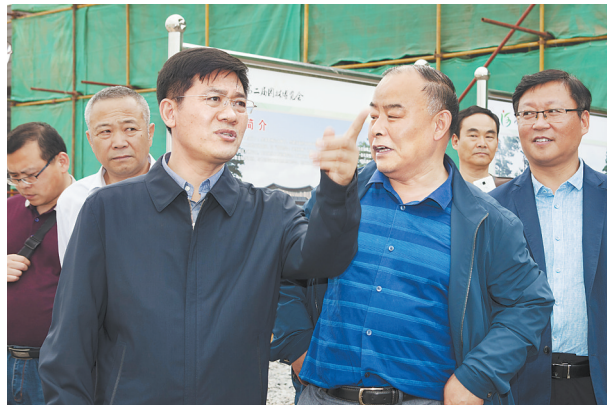
秦皇岛市委主要领导到工地督导工作。

筑之一的绿色馆。绿色馆用太阳能光伏板做屋面遮阳板,既满足了温室的需求,也充分利用了绿色能源。此外,种植土采用污泥厂处理后的材料,园区植物材料全部采用抗旱、耐寒等适生品种,节约养护品种;园区北大门的花伞等构筑物、绿色馆等园区建筑采取装配式建设方式,园区电气