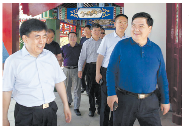
秦皇岛市政府主要领导到工地现场指导。

这是一次和时间的赛跑。2个主体建筑,15座园林建筑,14座服务建筑,21座车行桥,42座人行桥,141座