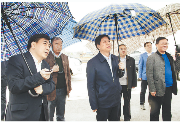
省住建厅主要领导到工地听取汇报。

园博园选址在秦皇岛经济技术开发区晒云山片区,总面积为2000亩,园内绿地面积达到1032亩,共种植各种乔木6万余株,各类植物品种636种。园博园依据晒云山原有自然山体地形,规划形成了“三谷一脉、三核双组团”的空间结构,三条山谷凸显特色,一条水脉贯穿南北,主场馆、绿色馆和晒云山山顶标志性建筑形