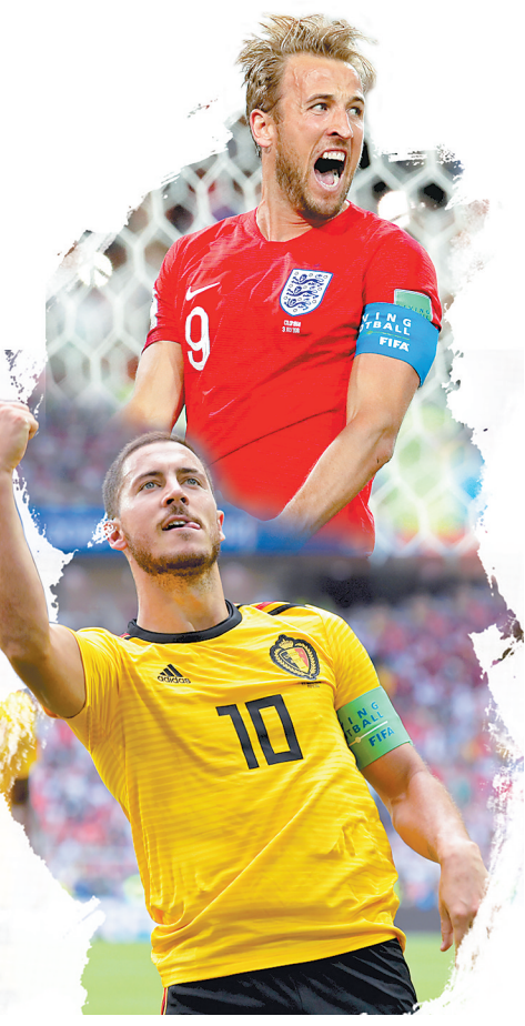
上图:7月3日,英格兰队球员凯恩在八分之一决赛中庆祝罚中点球。