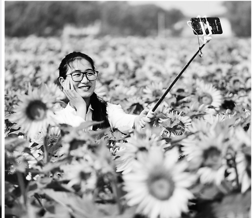
日前,游客在南宮市南杜村千亩向日葵基地留影。近年来,南宮市以农旅融合为重点,因地制宜打造集特色产业、休闲农业、生态旅游观光于一体的农业公园和田园综合体,辐射带动农业增效、农民增收。记者 赵永辉摄