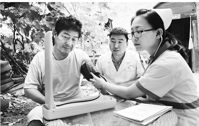
日前,桥东区祝村镇卫生院健康扶贫服务队的医生为双楼村村民量血压。今年以来,邢台市100余支健康扶贫服务队深入农村、社区开展义诊和咨询,累计为贫困患者减免费用320.1万元,救治贫困患者4.3万余人。

配方草籽实现农作物间作,通过零施肥、零除草剂、零打药的纯天然农作物生长模式,零污染、保产量,打造绿色有机农产品示范基地。据悉,实验田项目是奥地利绿色农业生产联合体项目的一部分。按照计划,奥地利绿色农业生产联合体项目占地面积1600亩,预计年产绿色粮食2000吨和农机5000台。