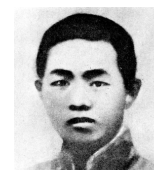
邓恩铭(资料照片)。

据新华社贵阳7月16日电(记者李惊亚)1931年4月5日,在山东省济南市纬八路侯家大院刑场,邓恩铭身负镣铐,与其他20名共产党员一起,高唱《国际歌》从容就义。