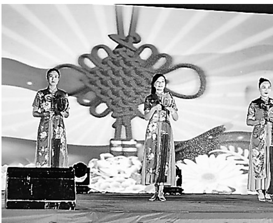
7月15日晚,由保定市文广新局主办、常青国际养老产业集团协办的2018保定市“彩色周末”惠民演出活动在军校广场举行。图为单弦联唱表演《保定好人赞》。

从事电商销售的企业增加到50余家,个体网店经营户2000余家,服务于企业、个体商户的电子商务平台5家,每天总发货量将近6000单,带动了创业就业,在电商产业带动下,全县直接增加就业3800余人,间接创造岗位1万余个。促进了精准扶贫,全县284个村全部建立了电商服务网点,互联网+扶贫模式正在发挥作用,5家龙头电商企业与贫困户签订农产品订购合同,去年签订合同的贫困户增收10%。