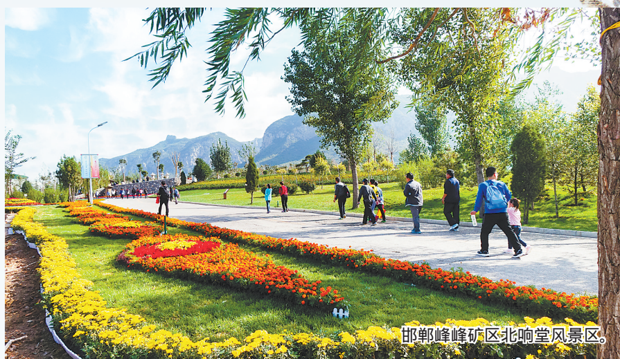
邯郸峰峰矿区北响堂风景区。

从2016年省委、省政府决定建立旅发大会平台机制,到2017年全省形成1+13+X省市县统筹推进的旅发大会新模式,全省旅游业以筹办旅发大会为契机,大幅提升基础设施与公共服务,大力开展造林绿化、改善生态环境,精心打造了一大批新项目、新业态和新片区,深度挖掘保护了一批又一批历史文化资源。旅发大会平台给河北旅游带来了前所未有的巨变。