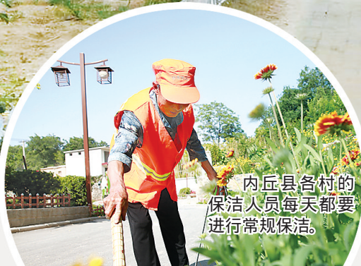
内丘县各村的保洁人员每天都要进行常规保洁。