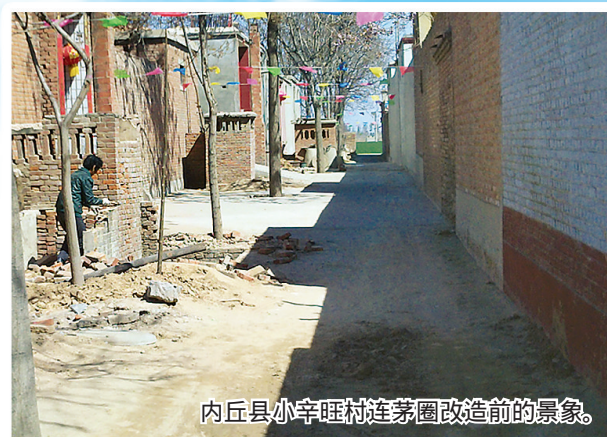
内丘县小辛旺村连茅圈改造前的景象。