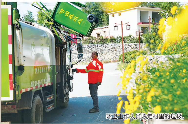
环卫工作人员收走村里的垃圾。