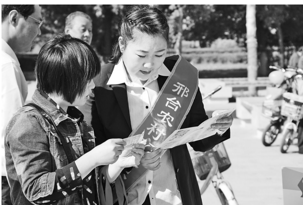
邢台农商行员工向客户宣传金融知识。

2012年12月15日,河北邢台农村商业银行股份有限公司在我省众多农信社中脱颖而出,率先完成改制工作,成为省联社启动“双改”工作以来第一家成功改制的股份制商业银行。成立之时,该行就制定了适合自身发展的三年规划。2016年,又全面制定了两年两翼、六核驱动(两体,即个人金融、企业金融,两翼,即小微金融、金融市场;六核,指社区银行、流程银行、县域金融综合银行、电子银行、直销银行和流动银行)的发展战略,以此推动邢台农商行“经营模式、盈利方式、业务结构、增长方式”四个转变。改制以来,邢台农商行不断优化