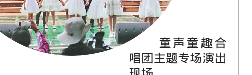
童声童趣合唱团主题专场演出现场