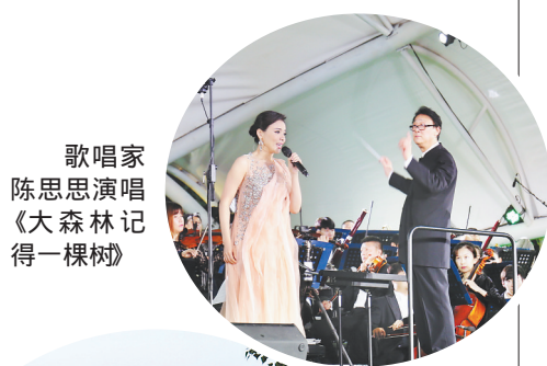
歌唱家陈思思演唱《大森林记得一棵树》

置身林海听壮歌,感人至深谱传奇。为了用音乐更好地弘扬塞罕坝精神,增强大众文化自信,凝聚社会文化合力,此次音乐会为塞罕坝量身定制了《大森林记得一棵树》《林为情思风作马》等多首精品原创歌曲,由陈思思、汤非等知名歌唱家深情演绎。阵容强大的演出队伍,是此次森林音乐会活动艺术品质的保证。