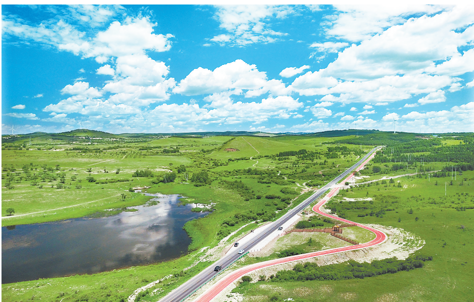
俯瞰国家一号风景大道

上半年,全省共接待海内外游客3亿人次,实现旅游总收入3186.10亿元,同比增长24.72%和34.28%。全省旅游呈现出强劲的优质发展势头。