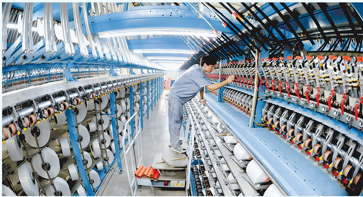
日前,衡水市冀州区引进的总投资22.3亿元的省重点建设项目,河北烨和祥新材料科技有限公司生物玉米纤维项目,生物基聚乳酸纤维已投入生产。近年来,冀州区积极探索多种招商引资方式,围绕装备制造等传统产业转型升级和电子信息、军民融合等新兴产业培育,大力开展延链、补链、强链、建链招商。