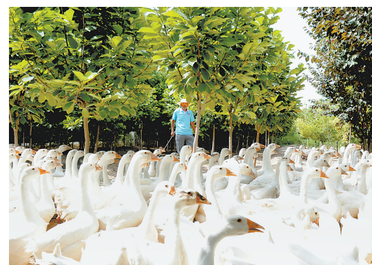
近日,南和县和阳镇森淼家庭农场的农民在喂食林下散养的大鹅。

小餐饮开办者不得经营裱花蛋糕、生食水产品以及法律、法规禁止经营的其他食品。小餐饮开办者需保证餐饮用具清洗、消毒设施运转正常,向消费者提供消毒合格的餐饮用具;刀具、案板生熟分开,且标识明显;原料、半成品、成品分开放置;植物性食品、动物性食品和水产品分类存放,防止交叉污染。小餐饮操作间和就餐场所均应在室内。卫生间不得设置在操作间内。有大小和数量能满足需要的食品冷冻冷藏设备设施。烹调区有机械排烟、排气装置。食品处理区、就餐场所、专间内设置足够数量的餐厨废弃物暂存容器。