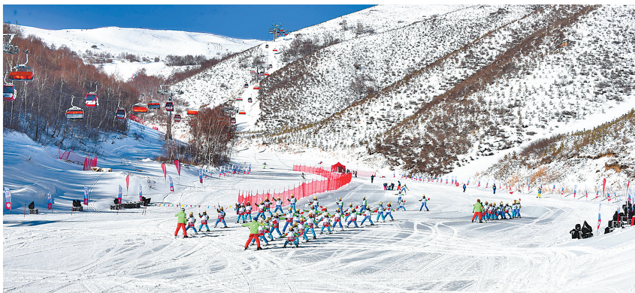
冬日的密苑云顶滑雪公园。