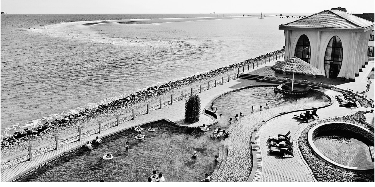
作为第二届唐山市旅游产业发展大会承办地，唐山国际旅游岛突出海洋海岛、旅居度假、生态休闲的旅游要素，在旅发大会期间举办了帆船比赛、露营文化节等相关活动，吸引广大游客的到来。这是游客体验海岛休闲游的乐趣。

海洋湿地资源作为唐山独特的自然资源，生态优势充分显现。以曹妃甸和唐山国际旅游岛的滨海湿地和海滨海岛为旅游品牌，形成“玩海、观海、品海”的特色旅游文化，受到京津游客青睐。同时，随着中国河豚鱼、东方对虾、