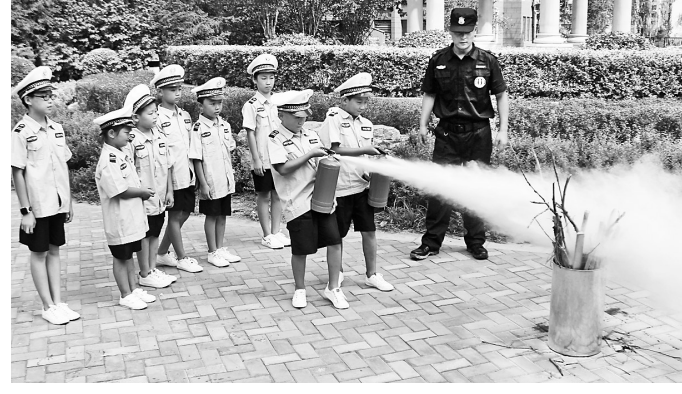
暑假期间，丰润区太平路街道组织辖区学生开展职业体验、欢度暑假活动，30多名小学生体验园艺师、消防员、保安等职业工作。这是小学生体验消防员工作。

迁安市图书馆原来建有以该馆为总馆、18个乡镇综合文化服务中心为分馆、80个村级阅读培训室为服务点的总分馆服务体系。在此基础上，今年以来，迁安市图书馆又建立了18个图书流动服务点，与该市沙河驿镇完全小学、杨店子中心小学等5所小学确立送书进校园服务关系，先后数十次走进乡村校园，让近30万册纸质图书、23.3万册电子书动起来。