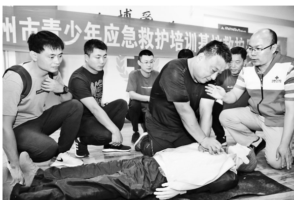
日前,共青团沧州市委、沧州市青少年宫邀请沧州市红十字会专业教师,举办了青少年急救知识集中培训,向学员讲解心肺复苏、创伤救护、常见急救知识等内容,并进行实际操作和模拟演练,以提高青少年自救互救能力。 记者 戴绍志 通讯员 魏志广摄