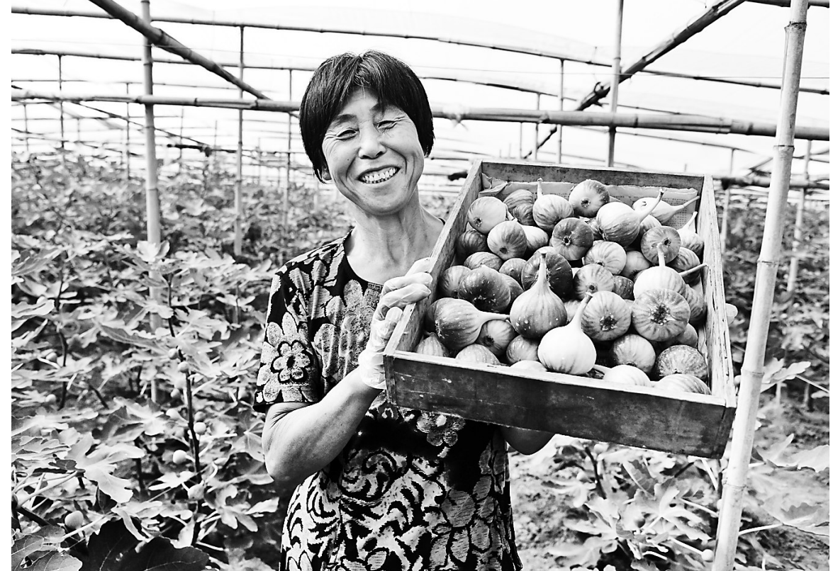
8月26日,河间市南冬村果农在展示采摘的无花果。近年来,河间市在推进农业供给侧结构性改革的进程中,积极引导农民调整农业产业结构,因地制宜以一村一品种植模式发展特色种植。目前,该市果品种植面积达12.7万亩,带动当地农民实现增收。 记者 王雅楠 通讯员 李世文撰

本报讯(记者戴绍志)日前,教育部办公厅公布了第三批现代学徒制试点单位,沧州医学高等专科学校成功入选,试点专业为护理系和药学系。这是继渤海理工职业学院后,沧州市第二家入选的学校。 现代学徒制试点是教育部于2014年8月提出的一项旨在深化产教融合、校企合作,进一步完善校企合作育人机制,创新技术技能人才培养模式的重要举措。近年来,沧州医学高等专科学校大力推行教育教学改革,积极探索现代学徒制人才培养模式,为成功申报试点奠定了坚实基础。 下一步,该校将以此为契机,探索建立校院(企)双主体、协同发展长效育人机制,形成入学、培养、就业直通格局。