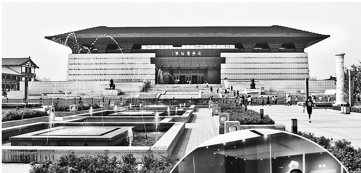
▲定州博物馆全貌。 ▶市民在参观文物银缕玉衣。

本报讯(阴若天)8月27日,定州博物馆正式对外开放,文物爱好者可以近距离观赏青玉龙螭衔环璧、东王公西王母故事玉座屏、白釉龙首莲纹大净瓶等国宝级文物。