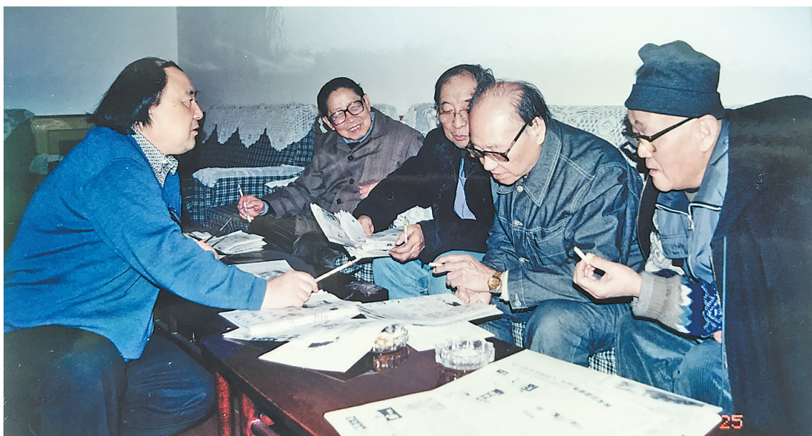
几位漫画家一起评稿