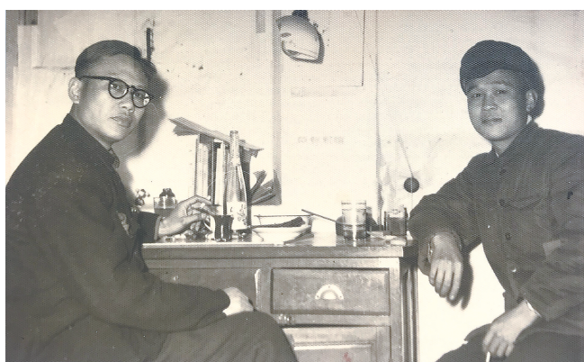
方成(左)和韩羽(1960年合影)

国际图书博览会，因为他们社里有我的出版物参加了展览。我心想，借参加此盛会顺便看望方成老哥，一举两得，何乐而不为。岂料临动身前，忽听朋友传来消息，说是方老病危住院了。去他家是不成了，可他住的是哪家医院呀？心中惴惴，真切地感到见一面少一面了。更挠心的是，一问司机，方知我们虽然是去北京，可却是六环路上的顺义，我们的车根本进不了三环路以内。老天爷，可咋办？进了北京六环路，旁边老伴儿的手机响了。待了一会儿，她小声说：方老，今天早晨去世了。我听了，却出乎意外的平静，轻轻地吐出一口气，似乎轻松了许多。我自己都惊讶起来，这是怎么了，是否我的脑子出了毛病？