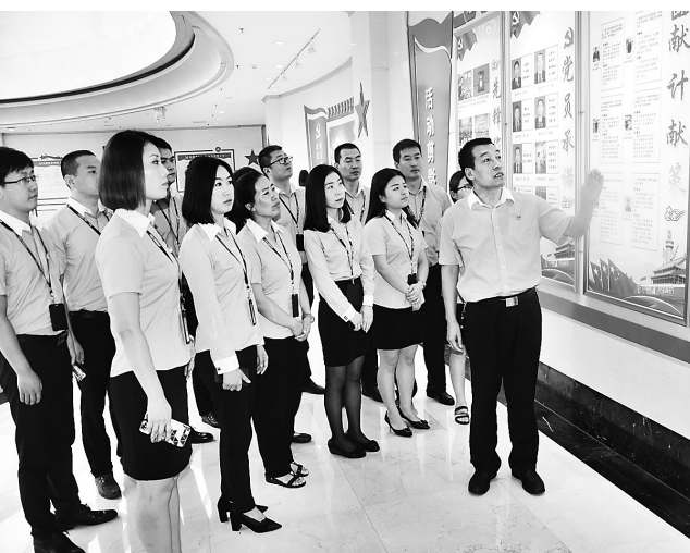
8月31日,巨力集团组织部分党员在综合党建活动中心,开展了党支部书记讲党课活动。近年来,巨力集团积极创建学习型党组织,不断加强党建阵地建设。

多为3种原因:一是车辆过于陈旧,车主弃在路边;二是车主因为各种原因离开本地,却来不及处置自己的车辆;三是被犯罪分子丢弃的一些盗抢车辆。交警部门提醒广大市民,随意丢弃车辆具有很大风险,车辆或牌照很可能被不法分子利用作为犯罪工具,建议车主对于老旧车辆及时办理报废手续,并欢迎市民举报“僵尸车”。