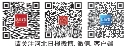
请关注河北日报微博、微信、客户端

新华社北京9月4日电(记者郑明达、孙奕)4日,2018年中非合作论坛北京峰会闭幕后,国家主席习近平同论坛前任共同主席国南非总统拉马福萨、新任共同主席国塞内加尔总统萨勒在人民大会堂共同会见记者。 习近平在讲话中指出,中非合作论坛成员方领导人齐聚北京,围绕合作共赢,携手构建更加紧密的中非命运共同体主题,谋划中非关系未来发展,绘制中非合作宏伟蓝图。会议发表了《关于构建更加紧密的中非命运共同体的北京宣言》,通过《中非合作论坛-北京行动计划》,向世界传递了中非携手并进的强烈信号。 习近平指出,中非领导人一致同意,携手打造责任共担、合作共赢、幸福共享、文化共兴、安全共筑、和谐共生的中非命运共同体。中非要加强战略对接和政策协调,推进共建“一带一路”合作,重点实施好产业促进、设施联通、贸易便利、绿色发展、能力建设、健康卫生、人文交流、和平安全“八大行动”。中国将继续秉持真实亲诚理念和正确义利观,同非洲一道,推动中非全面战略合作伙伴关系向深走实、行稳致远。 习近平强调,中非合作一贯坚持互利共赢、开放包容。希望国际合作伙伴形成合力。(下转第五版)