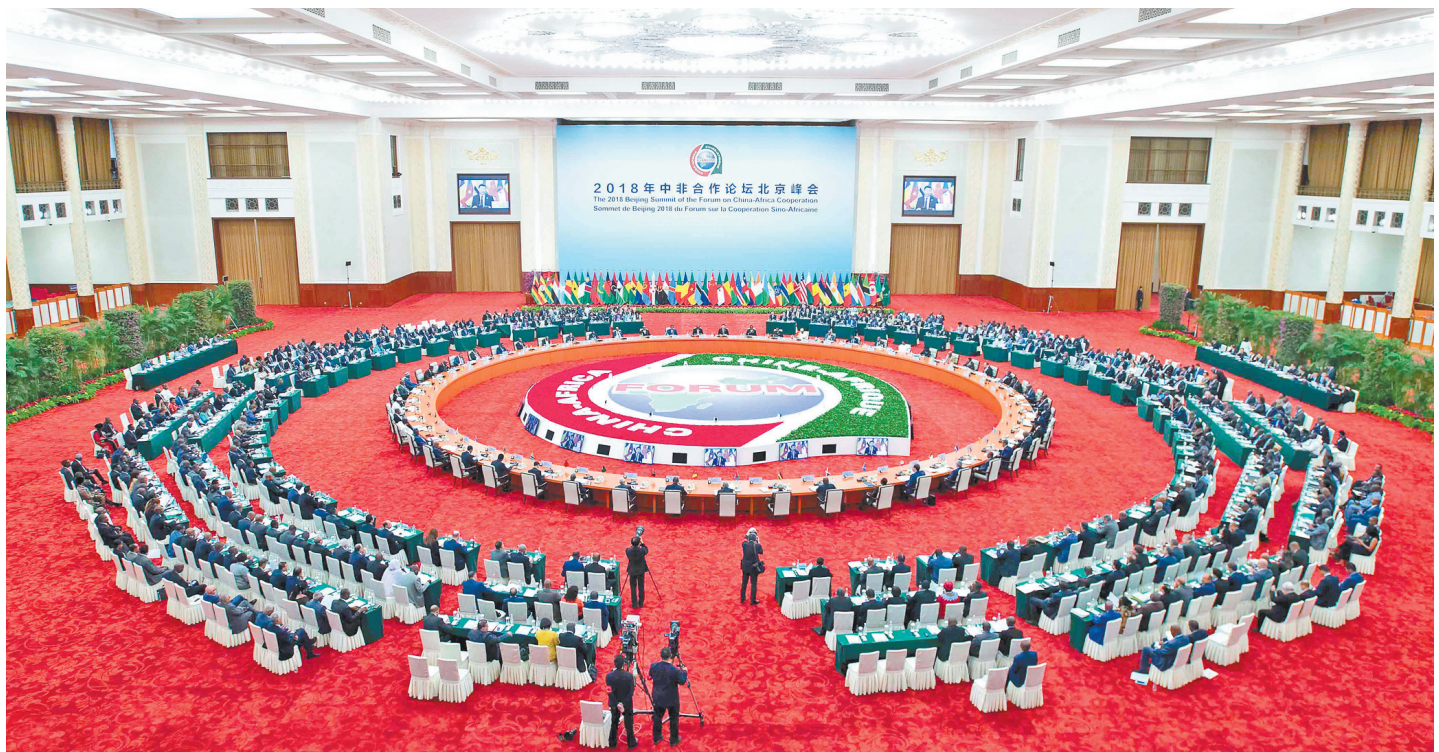
9月4日,中非合作论坛北京峰会圆桌会议在北京人民大会堂举行。国家主席习近平和论坛共同主席国南非总统拉马福萨分别主持第一阶段和第二阶段会议。

新华社北京9月4日电(记者王卓伦、刘羽佳)中非合作论坛北京峰会圆桌会议4日在人民大会堂举行。国家主席习近平和论坛共同主席国南非总统拉马福萨分别主持第一阶段和第二阶段会议。会议通过《关于构建更加紧密的中非命运共同体的北京宣言》和《中非合作论坛-北京行动计划(2019-2021年)》。 上午10时,习近平同论坛共同主席国南非总统拉马福萨及其他53个论坛非洲成员代表团团长一同步入会场。习近平宣布会议开始。 与会各方重点就推进中非关系、深化各领域合作、构建更加紧密的中非命运共同体、共建“一带一路”以及共同关心的国际和地区问题发表了看法。 习近平强调,两年来,北京峰会围绕“合作共赢,携手构建更加紧密的中非命运共同体”这一主题,凝聚合作共识,对接发展战略,再次唱响中非合作共赢、共同发展主旋律。 习近平指出,论坛北京峰会共同回顾了中非合作论坛成立18年来特别是2015年约翰内斯堡峰会以来中非全面战略合作伙伴关系取得的长足发展,审议了中非“十大合作计划”全面落实情况,对此感到满意。我们一致决定携手打造责任共担、合作共赢、幸福共享、文化共兴、安全共筑、和谐共生的中非命运共同体,筑牢中非关系政治基