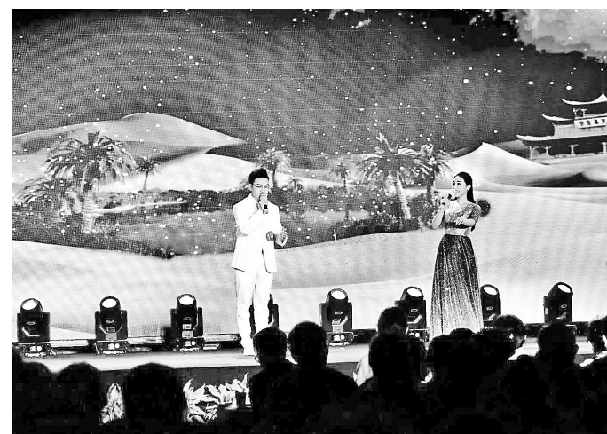
9月15日,首届新声大学生语言文化艺术节开幕式暨朗诵大赛决赛在河北大学举行。本次艺术节由省语言文字工作委员会、省教育厅主办,旨在提升大学生的语言文化素养与应用能力,提高语言教学水平。

按照协议,保定市检察院将和高校加强人员交流,推进人员互派、互聘。该院聘任高校教授担任检察官助理,为公益诉讼提供理论、实践热点问题及新出台法律法规司法解释,提高检察官的理论素养和业务水平。