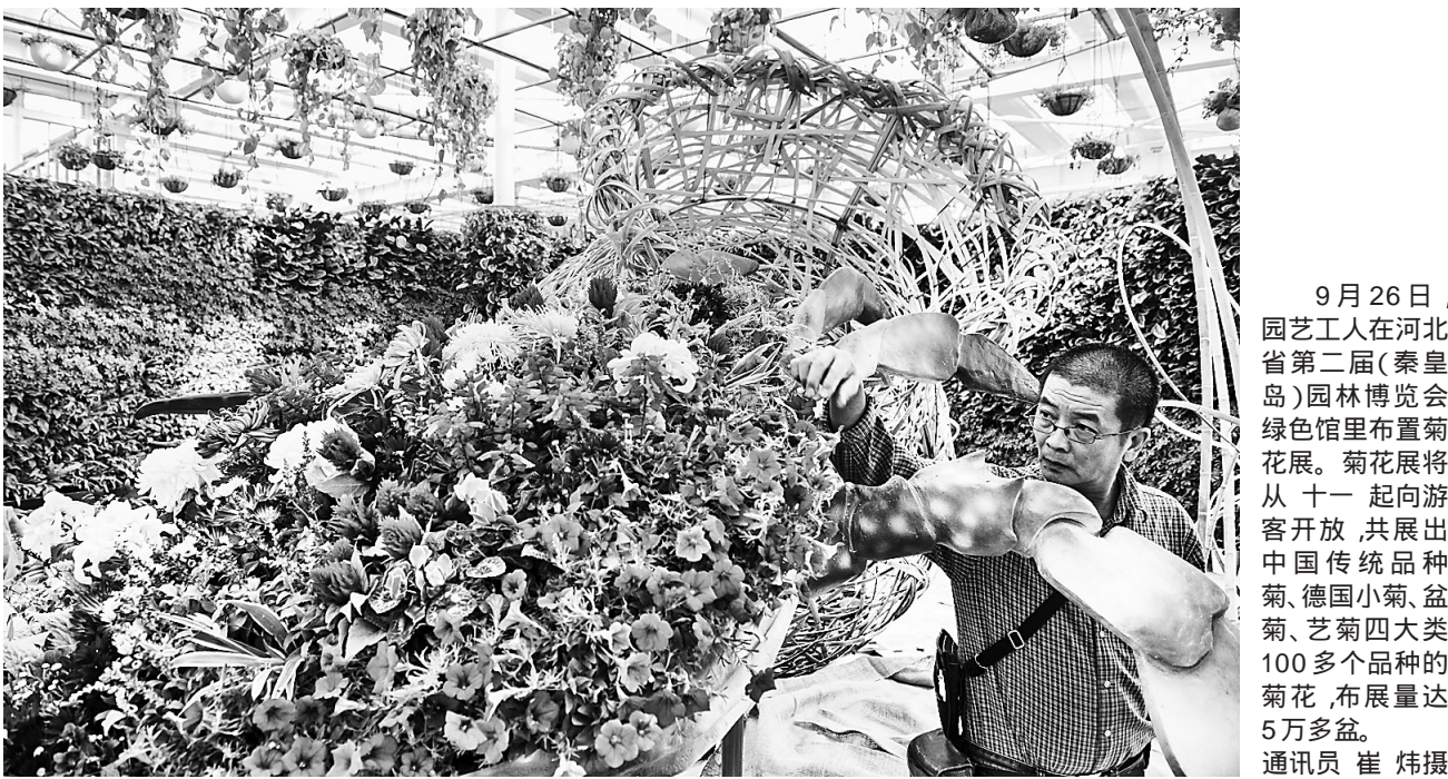
9月26日,园艺工人在河北省第二届(秦皇岛)园林博览会绿色馆里布置菊花展。菊花展将从十一一起向游客开放,共展出中国传统品种菊、德国小菊、盆菊、艺菊四大类100多个品种的菊花,布展量达5万多盆。

秦皇岛开发区建立以来,全区累计批准外资项目700余个,实际利用外资36.8亿美元,已有35个国家和地区的客商投资落户,美国通用电气、英国TI、韩国LG等一批世界500强企业和跨国公司落地兴业。