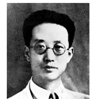
瞿秋白(资料照片)。

据新华社南京9月27日电(记者邱冰清)瞿秋白,中国共产党早期领导人之一,伟大的马克思主义者,杰出的无产阶级革命家、理论家和宣传家,是中国革命文学事业奠基人之一。1899年1月出生于江苏常州。1917年考入北京俄文专修馆学习。1920年以《晨报》特约记者身份赴苏俄采访,先后撰写多篇通讯。