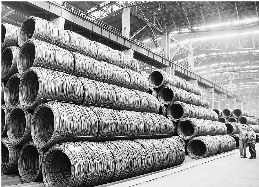
河钢宣钢以满足高端客户个性化需求为导向,积极组织轴承钢新产品试验生产,以高端客户需求倒逼产品质量升级。截至目前,直供山东某大客户557吨4个规格的轴承钢线材全部实现批量生产,经检测,热顶锻、硬度等性能指标均满足客户需求。这是线材事业部工艺质量工程师在检查轴承钢线材质量。

农行杯 2018河北省文化创意设计大赛高校宣讲季自9月1日正式启动以来,已经先后举办了河北科技大学站、廊坊师范学院站、河北美术学院站、唐山学院站和河北北方学院站。在接下来的半个月,高校宣讲活动仍将继续。