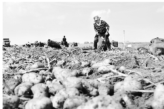
金秋时节,察北管理区马铃薯种植基地一派繁忙。据介绍,今年察北管理区种植马铃薯近5万亩,大面积推广膜下滴灌技术,亩均增产近千斤。

计提供信贷资金18亿元,其中向高铁主线投放贷款16.62亿元,向崇礼支线投放贷款1.47亿元。同时,为当地工程指挥部、4个施工标段以及附近6个乡镇村民提供结算、资金监管、代发拆迁补偿等服务,为冬奥会筹办和京津冀协同发展积极贡献力量。