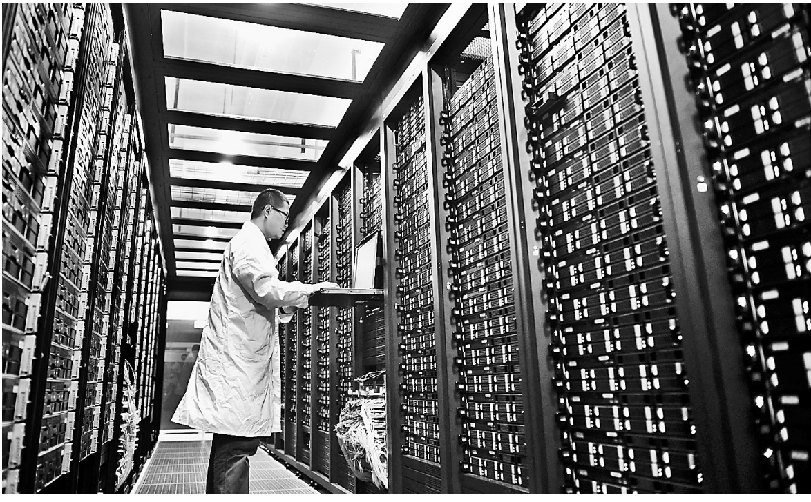
近日,位于涿州的东方地球物理公司科技园高性能计算机机房内,科研人员在处理地震数据。

本报讯(李淑玲、李绍芳)非常感谢人行清苑支行学雷锋志愿服务站的志愿者,帮我及时获得助学贷款,圆了我的大学梦。