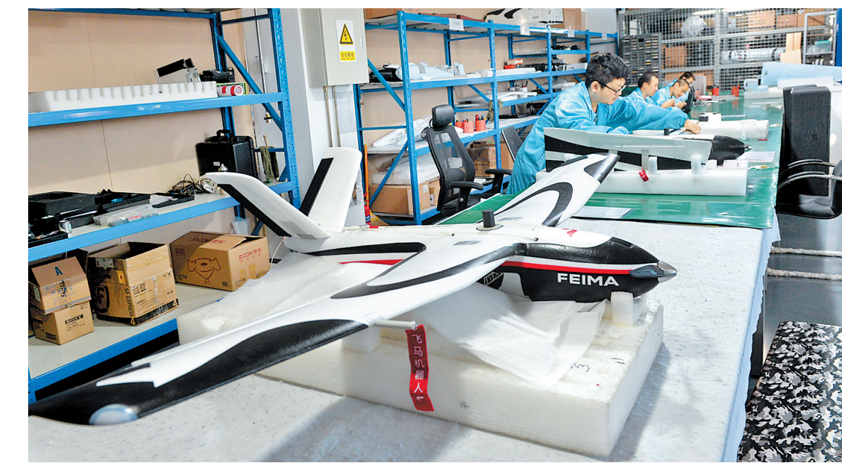
10月22日,河北飞图科技有限公司工作人员在位于香河机器人小镇的硬件研发生产基地组装无人机,该公司生产的无人机远销柬埔寨、安哥拉等地。近年来,香河机器人小镇对接全球创新资源,不断引进知名机器人企业。截至目前,小镇已聚集110余家机器人企业,形成了产业研发、核心零部件制造、系统集成及机器人本体制造的完整产业链条。

报告建议,各级政府和各有关部门应强化源头治理,坚决压减过剩产能,按照到2020年全省钢铁产能控制在2亿吨以内的目标要求,分解任务,压实责任。充分运用法治手段,严格执行环保、能耗、水耗、质量、技术、安全等标准,倒逼不达产能退出市场,加快调整能源消费结构,推进清洁取暖,加强散煤管控,坚决做到劣质散煤清零。着力加强建筑施工、道路运输、矿山码头、工业料堆等扬尘治理,有效控制扬尘污染。