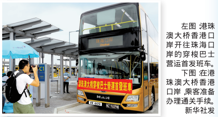
左图 港珠澳大桥香港口岸开往珠海口岸的穿梭巴士运营首发班车。右图 在港珠澳大桥香港口岸,乘客准备办理通关手续。