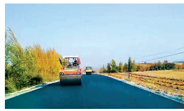
建行邢台分行e信通解决企业融资难