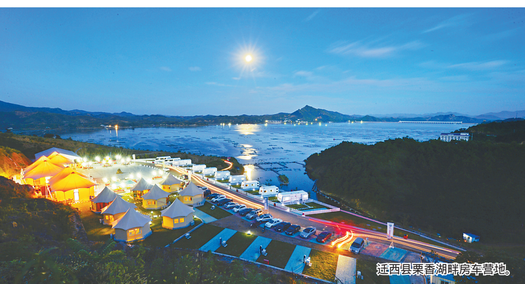
迁西县栗香湖畔房车营地。

可喜的是,经过两年多的实践,各创建单位突破传统思维模式,在深化体制机制改革、制定高标准规划、建设高质量项目、提升旅游环境和服务等方面取得诸多创新亮点。