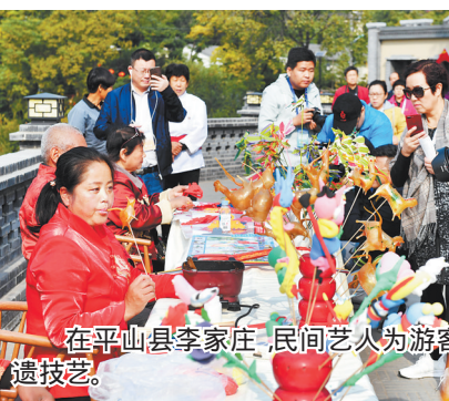
在平山县李家庄,民间艺人为游客展示非遗技艺。

是改革创新。今年8月31日在迁安召开的全省全域旅游创建工作现场会上,省旅游委副主任王虎指出,创新才能让示范区具有真正的示范意义。