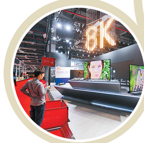
在进博会消费电子及家电展区,8K高清图像的电视令人仿佛置身于画面中。