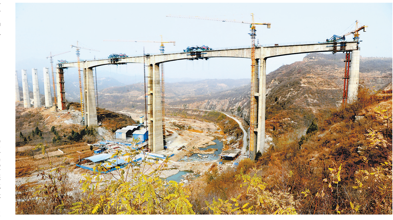
11月8日,中交隧道局承建的和邢(山西和顺至邢台)铁路宋家庄川特大桥主跨桥顺利合龙。有着我省最高铁路桥之称的邢邢铁路宋家庄川特大桥,全长954.505米,3个主墩分别高66米、80.5米、76米。该特大桥主跨的顺利合龙,为全线建设奠定了基础。记者 杜柏林 通讯员 邱林媛

本报讯(记者刘雅静 通讯员郭晓通)11月11日,张家口市政府与中国兵器工业集团北方车辆集团有限公司、经易控股集团有限公司在京举行张家口北方军民融合山地冰雪装备产业园项目合作框架协议签约仪式。按照协议,将整合三方优势资源,协同融合、合作共赢,打造推动张家口冰雪产业发展新引擎。 该项目位于张家口高新技术开发区,以中德模式实施,旨在抢抓举办冬奥会重大机遇,吸引落地一批国际一流的山地冰雪装备项目。