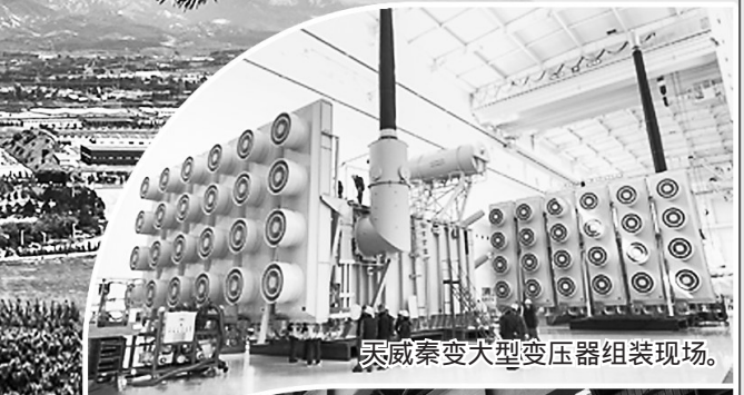
天威秦变大型变压器组装现场。