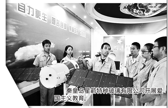
秦皇岛星箭特种玻璃有限公司开展爱国主义教育。