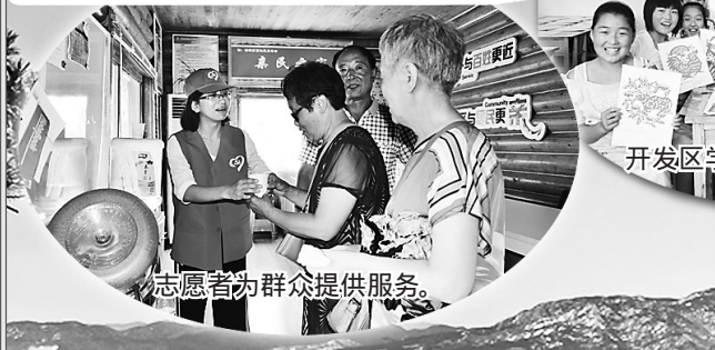
志愿者为群众提供服务。

伴着改革开放的春风,1984年经国务院批准设立 秦皇岛经济技术开发区成为全国首批、河北省首家国家级经济技术开发区。30多年来,秦皇岛经济技术开发区经历了从无到有、由小到大的巨大跨越,先后获得 中国创造力开发区 最佳投资环境开发区 最具发展潜力园区 河北省经济发展先进开发区 全国首批民生改善典范开发区 国家绿色体系制造园区 等多项荣誉称号。 建区以来,秦皇岛经济技术开发区始终坚持 以诚 招商、以优 便商、以信 安商,不断优化服务举措,创新服务内容,深入推进行政审批改革,全力打造优质的投资环境。从1985年秦皇岛邦迪管路系统在秦皇岛经济技术开发区注册成为开发区引进的第一家外商投资企业,至今已有美国通用电气和ADM、新加坡丰益以及中