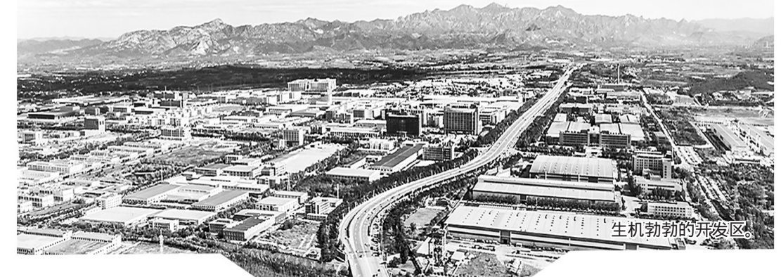
生机勃勃的开发区。

进入新时代,秦皇岛经济技术开发区继续积极推进产业结构调整,着力发展战略性新兴产业,大力提升自主创新能力,并主动承接京津产业转移,更加注重生态环境建设和民生改善,全区步入大力推动创新发展、绿色发展、高质量发展的新阶段。一幅山水一体、经济与生态共赢的唯美画卷正在这里绘就。