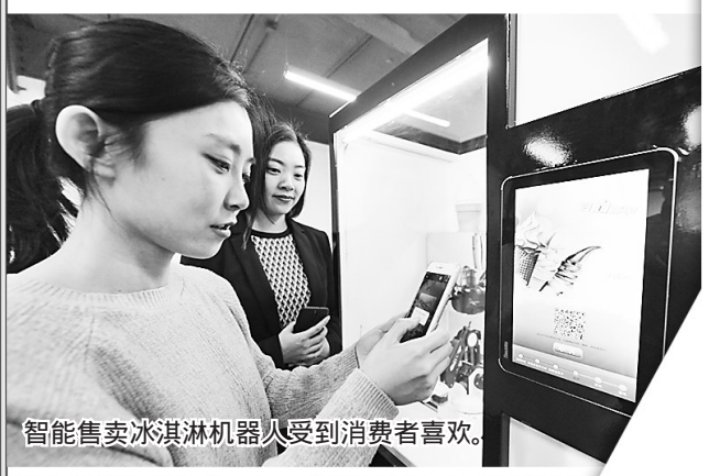
智能售卖冰淇淋机器人受到消费者喜欢。