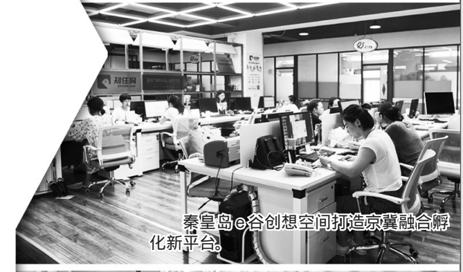
秦皇岛e谷创想空间打造京津冀融合孵化新平台。