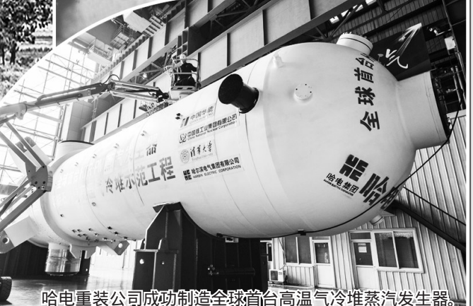
哈电重装公司成功制造全球首台高温气冷堆蒸汽发生器。