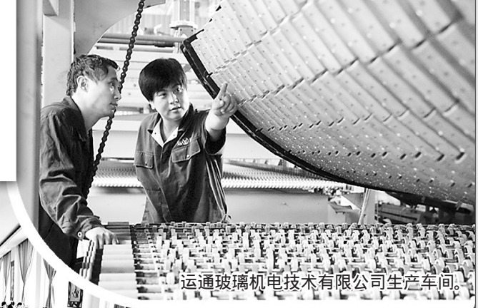
运通玻璃机电技术有限公司生产车间。