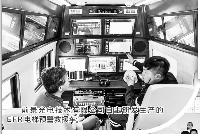
前景光电技术有限公司自主研发生产的EFR电梯预警救援车。