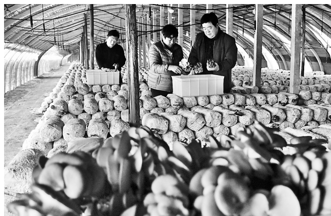
11月12日,南和县和阳镇路庄村村民在自家大棚内采摘蘑菇。南和县在实施乡村振兴战略过程中,引导农民利用冬闲时节培育食用菌,成为农民增收的重要渠道。路庄村仅食用菌栽培一项,每年就可实现利润150多万元。

加强现场查处。各交警大队坚持路面查缉与场所排查相结合,深入辖区二手车交易市场、停车场、车辆修理厂、报废车回收企业、汽车美容装饰网点等处排查,对车牌与车明显不符车辆、旧车新牌、新车无牌等车辆,逢疑必查。