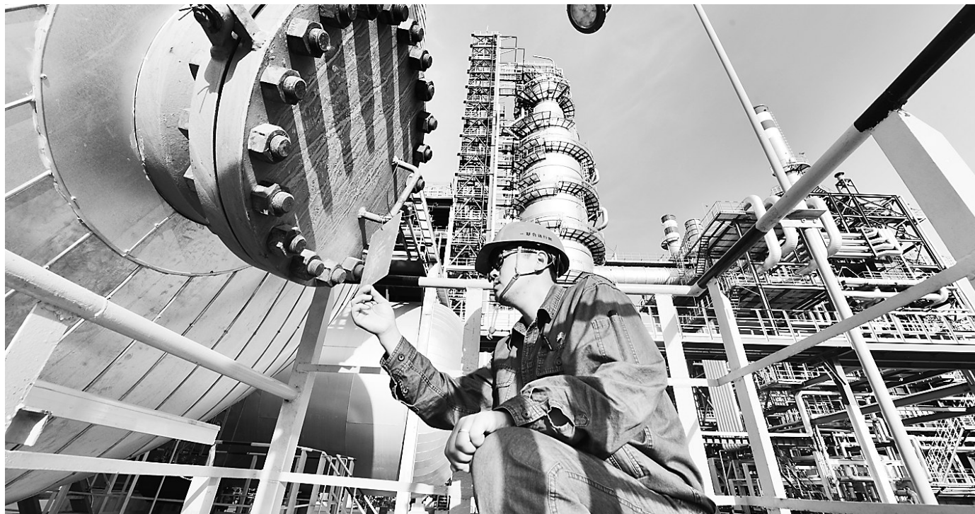
日前,华北石化公司已经进入冬季生产状态,这是该公司千万吨升级改造项目全面建成后的第一次新装置过冬。为此,该公司严格按照在用装置标准进行冬季安全生产准备,共梳理、检查工艺流程伴热管线2000余条,确保无一处漏点、破损。这是华北石化公司员工在检查新建的常减压装置防冻防腐工作。

今年建设的旅游厕所,是国家A级旅游景区、旅游度假区、生态旅游示范区、乡村旅游点、工业旅游点、研学旅游基地、星级旅游饭店、旅游购物点、自驾车房车营地、旅游驿站、旅游小镇、旅游集散中心和游客服务中心等涉旅游场所的旅游厕所。其中,乡村旅游点包括休闲农业与乡村旅游示范点、乡村旅游示范村、乡村旅游扶贫重点村等旅游活动场所。