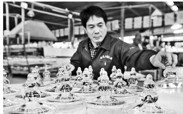
在南皮县晶莹玻璃器皿车间,工人在摆放刚下线的玻璃器皿。近年来,该县引导企业加大产品研发力度,推动工艺玻璃产业提档升级。如今,该县生产的工艺花瓶等工艺玻璃产品远销20多个国家和地区。

除此之外,献县还推进了教育扶贫 一对一 实现了结对扶贫全覆盖。城区学校对口帮扶农村薄弱义务教育学校,乡镇中心校对口帮扶所在乡镇中心小学、教学点,全县完全小学校长及以上教育干部,与所有建档立卡户进行一对一 结对定向定向帮扶,不让一个孩子因家庭贫困失学、辍学。