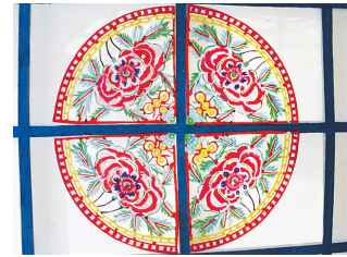
亮子上的圆光剪纸