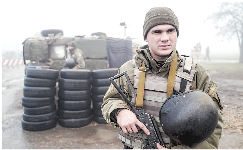
11月27日,在乌克兰东部城市别尔江斯克,士兵在一处检查站执勤。

要在亚速海及黑海水域与美国、欧盟协同挑起与俄冲突,否则将导致严重后果。俄方将严厉制止危害俄主权和安全的任何行为。