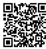
白皮书全文 见河北新闻网

白皮书说,实现更加充分的人权保障,中国还有很长的路要走,仍面临许多困难和挑战。当前,在以习近平同志为核心的党中央的坚强领导下,中国人民正为实现两个一百年奋斗目标、实现中华民族伟大复兴的中国梦而努力。再经过几十年的不懈奋斗,中国人民的各项权利必将得到更好和更高层次的保障,中国人民将更加享有尊严、自由和幸福。