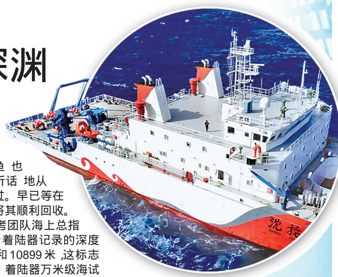
12月10日,沈括号抵达挑战者深渊海域。

彩虹鱼科考团队海上总指挥崔维成说,两台着陆器记录的深度分别为10918米和10899米,这标志着第二代彩虹鱼着陆器万米级海试成功。接下来,它们将马不停蹄地执行采样作业,在马里亚纳海沟采集科学样品。