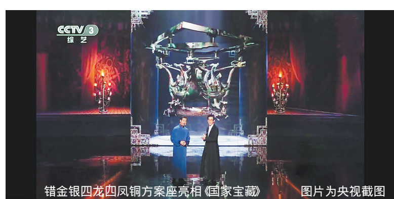
错金银四龙四凤铜方案座亮相《国家宝藏》

中山王髹,北伐迎燕、南战击赵,使中山一时璀璨成为名邦,自己也因此成为一代名君。在征讨战急、国事繁忙的时期,中山王髹夜以继日勤奋理政,或许,他就伏在那只心爱的龙凤方案上批阅图,抑或伏案稍憩休养生息以待再劳。龙凤方案熏染了国君的气息甚至汗水,龙首凤身或许渗透着君王把玩摩挲的余温,前方传来的捷报可能被呈至案头,喜悦的国王必定置酒