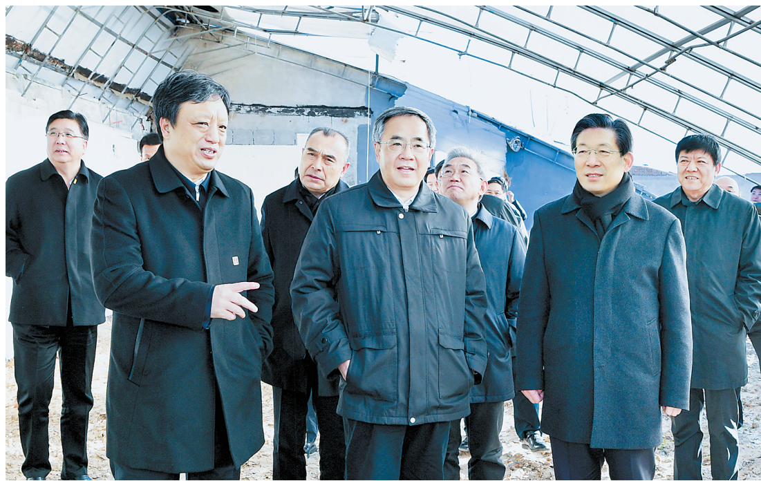
中共中央政治局委员、国务院副总理胡春华8日在河北、北京、天津等地调研 大棚房 问题清理整治工作。这是胡春华在我省大厂回族自治县陈府镇调研检查。

本报(新华社记者 本报记者)中共中央政治局委员、国务院副总理胡春华8日在河北、北京、天津等地调研 大棚房 问题清理整治工作。他强调,要坚决贯彻习近平总书记重要指示精神,认真落实党中央、国务院决策部署,进一步提高政治站位,切实履职尽责,深入排查、彻底清查,坚决整治、加快整改,强化追责问责,不折不扣抓好 大棚房 清理整治工作,确保按时保质完成整治任务,坚决遏制农地非农化乱象。